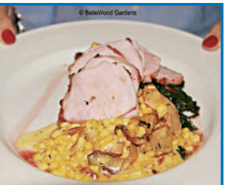
★Wildwood餐館內各式精緻美味餐點，讓人回味無窮。