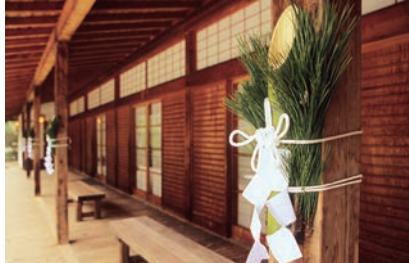
★不管什麼季節，日式庭園都給人舒服的感覺。