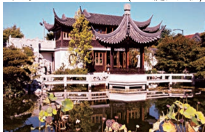
★充滿中國色彩的蘭蘇園。