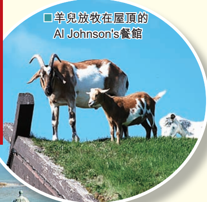
羊兒放牧在屋頂的Al Johnson's餐館

從「半島公園」的灣壁遠望，祇見「綠灣」煙波浩瀚，肉眼看不見的彼岸是密西根州，而綠灣的盡頭是綠灣市，著名美式足球隊「綠灣包裝工」(Green Bay Packer)的大本營。車行約大半時至Ephraim小鎮，全市的建築物劃一白色，全縣最古老、建於1857年的