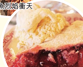
門縣的櫻桃批，頂呱呱！

在每年五月，位於「魚溪」的Lautenbach's Orchard County和在「姊妹灣」的Seagist Orchard等果園均是看櫻桃的好去處。