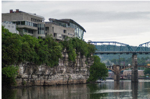
亨特博物館，懸岩而立。

人在旅途，挑選遊點，通常均是慕名前往，深信繁華鬧市，遊客勝地，一定萬無一失。一些籍籍無名，在地圖難找，名字難唸的二、三線城市往往被大家忽略。但每每「禾稈匹珍珠」，有些沒名氣的地方倒會出奇地令你驚喜，帶給你意想不到的美景美地。田納西州的查大努嘉市(Chattanooga)便是這樣的一處地方。