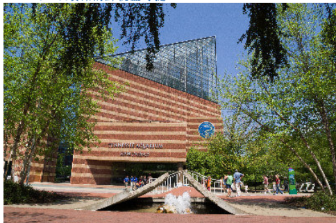
田納西州水族館，外形新穎。