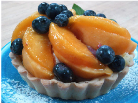
212 Market 餐館的鮮桃藍莓撻。

April 21, 2013 05:00 AM | 3215 次 | 0 評論 | 9 讚 | 0 收藏 | 0 分享