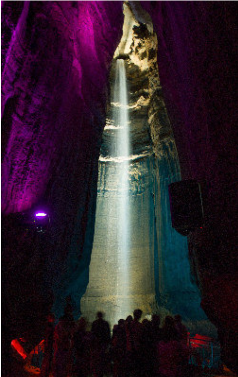
彩燈照耀下的紅寶石瀑布。

地上瀑布你可能遊歷不少，但地下瀑布你曾否見過呢？位於「眺望山」山腰岩洞深處的「紅寶石瀑布」(Ruby Falls)，高145尺，但隱藏在1100呎深的地下溶洞之內，為美國