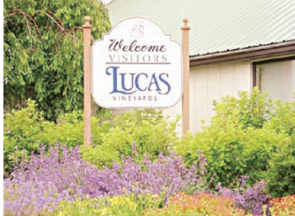
★Lucas酒莊近年釀製的紅酒屢次獲獎。