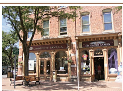
★Skaneateles市中心一景。