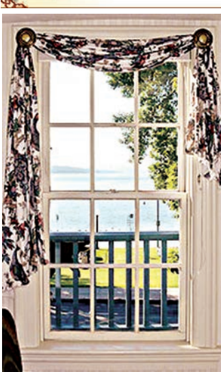
★左圖：兩百年老店Sherwood Inn窗外看出去即可見Skaneateles湖的景色。