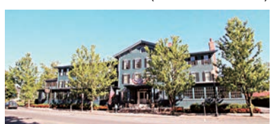
★右圖：Sherwood Inn外觀。

另一非常迷人的地方在Skaneateles湖畔的Skaneateles小鎮，離雪城一小時車程。