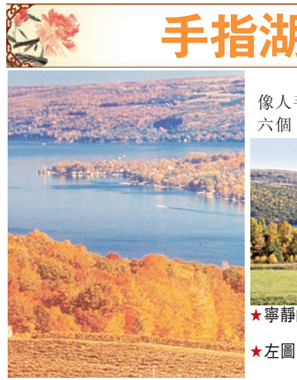
★寧靜的手指湖一景。